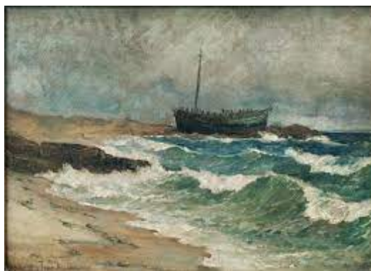
Ιωάννης Αλταμούρας, Θαλασσογραφία (1874)