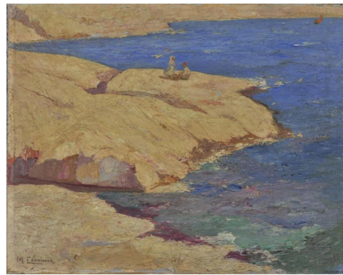
Μιχάλης Οικονόμου, Θαλασσινό τοπίο (1920 – 1926)

Σημείωση: Για τον σχολιασμό των πινάκων ζωγραφικής καλό θα είναι να έχει προηγηθεί συζήτηση όπου, μέσω ερωτήσεων που θέτει ο/η εκπαιδευτικός, οι μαθητές/τριες θα έχουν εξοικειωθεί α) στο να παρατηρούν έργα τέχνης (Τι βλέπετε / Τι παρατηρείτε στον πίνακα;), Τι νομίζετε ότι συμβαίνει στον πίνακα; (ενεργοποίηση σκέψης), Υπάρχουν απορίες που σας γεννώνται βλέποντας το έργο; Τι περισσότερο θα θέλατε να μάθετε; (εμβάθυνση).].